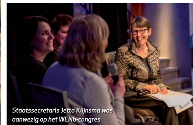
Staatssecretaris Jetta Klijnsma was aanwezig op het WENb-congres

'De participatiesamenleving vraagt om een rigoureuze ombouw, óók bij werkgevers'